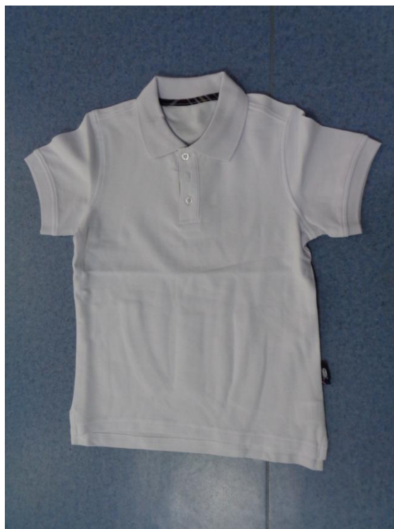
白色短袖 T 恤