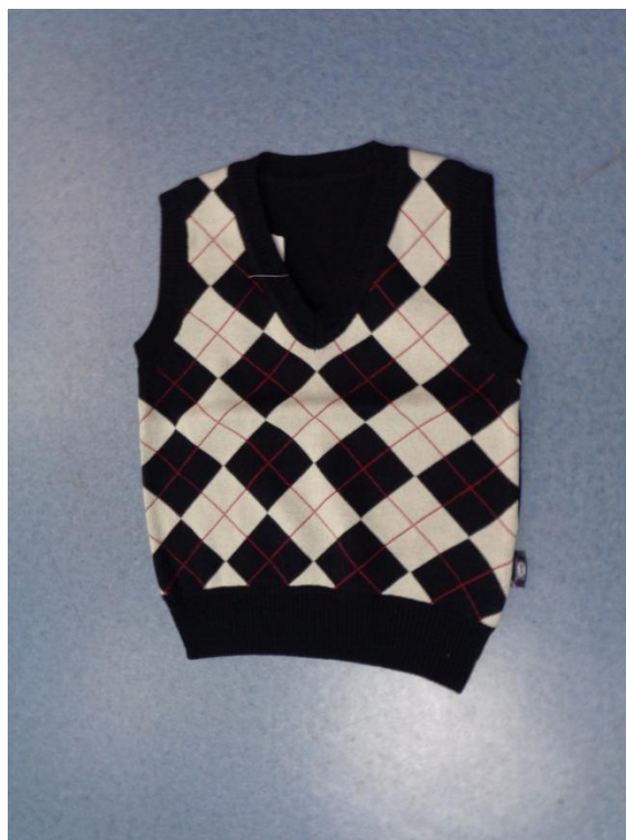
藏青格子毛衣背心