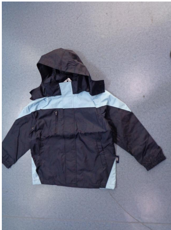
藏青浅蓝色拼接冲锋外套