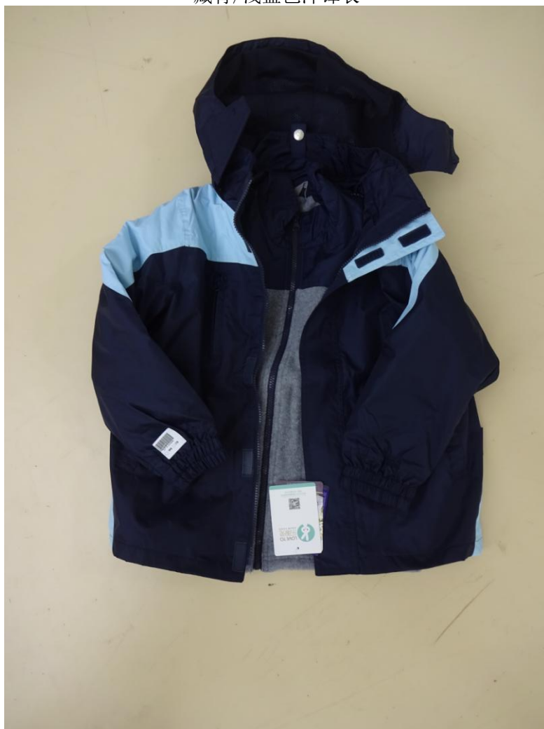
藏青/浅蓝色冲锋衣